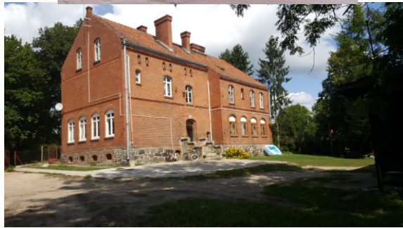
Budynek po byłej szkole obecnie wykorzystywany jako budynek mieszkalny