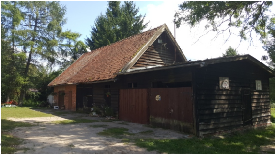
Garaże na terenie opracowania