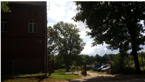
Obszar opracowania wykorzystywany jako parking.