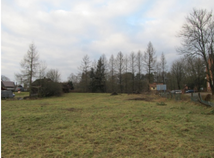
Zieleń niska na terenach sąsiednich - w oddali zabudowa mieszkaniowa