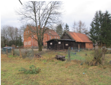
Garaże na terenie opracowania