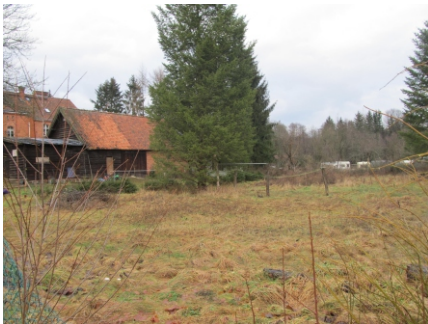
Nie zabudowana część obszaru opracowania