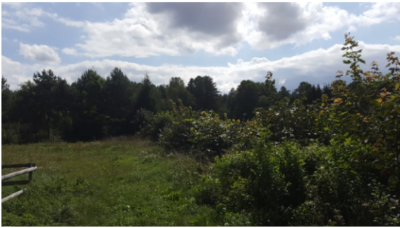
Nasadzenia zadrzewień i zakrzewień w miejscu wyciętych drzew