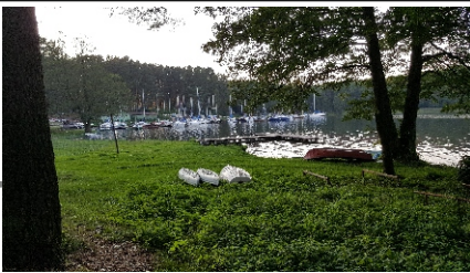
Część plaży wykorzystywana jako boisko do siatkówki