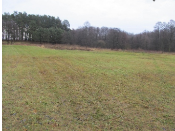
Zieleń niska na terenie sąsiednim