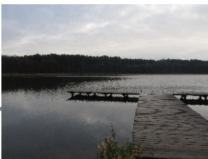
Jeden z pomostów