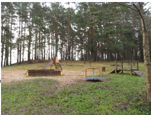
Plac zabaw w oddali teren lasu