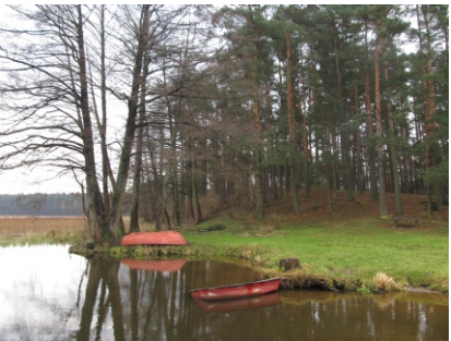
Obszar skarpy nadbrzeżnej jeziora Nidzkiego