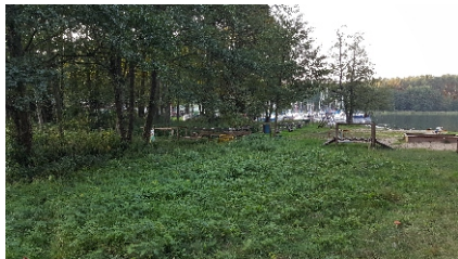
Enklawa zieleni wysokiej