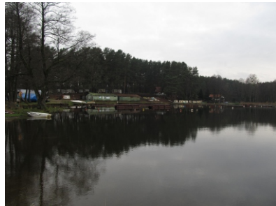
Pomosty dla jachtów