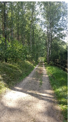
Fragment drogi gruntowej - wewnętrznej