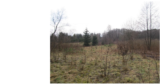
Tereny sąsiadujące z obszarem opracowania