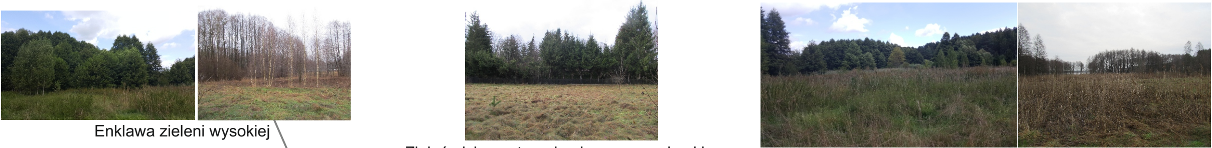
Enklawa zieleni wysokiej