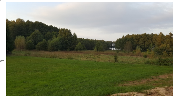
Obszar okresowo podmokły