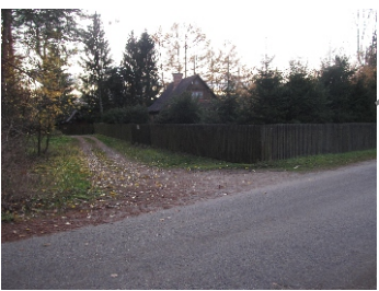
Zabudowa letniskowa w sąsiedztwie