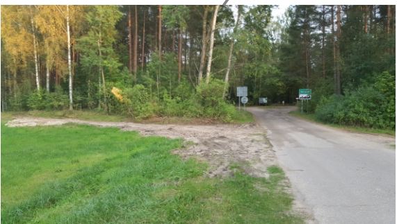
Drogi w sąsiedztwie obszaru opracowania