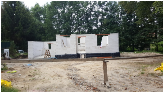
Rozpoczęta zabudowa w sąsiedztwie