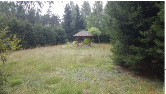
Altana na obszarze opracowania