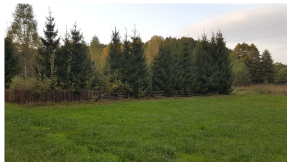
Nasadzenia zieleni wysokiej wzdłuż granic działki