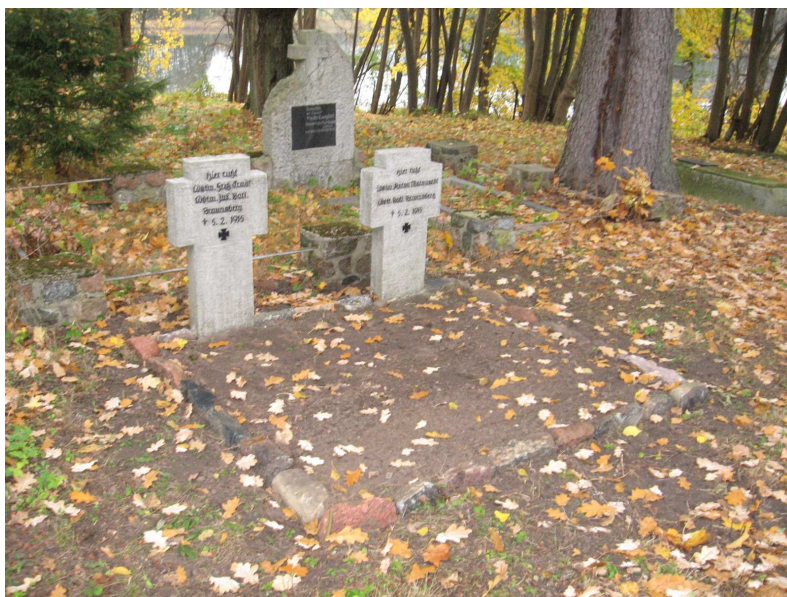
Mogiły żołnierzy niemieckich

W miejscowości jest plaża wiejska i boisko , które znajdują się na tej samej działce oznaczonej numerem geodezyjnym 85. Teren położony jest nad jez. Wejsunek. W tym miejscu znajduje się scena. Tutaj odbywa się większość wydarzeń plenerowych organizowanych przez sołectwo, takich jak występy muzyczne, turnieje i zawody. Mieszkańcy darzą to miejsce szczególną estymą. Plaża i boisko to teren po byłej i nieistniejącej już szkole podstawowej, która swoje funkcjonowanie rozpoczęła w roku 1848. W szkole przez pierwsze lata uczono po polsku i po niemiecku. W roku 1875 język polski został ze szkoły wyrugowany. Szkoła została zamknięta z powodu małej ilości dzieci uczęszczającej do niej, a budynek został sprzedany prywatnemu inwestorowi. W Wejsunach znajduje się również zabytkowy cmentarz oraz kościół ewangelicki, który stanowi jeden z najstarszych zabytków Wejsun. Zabytki są ważnym elementem historii Wejsun. W 2008 r. z pieniędzy Rady Ochrony Pamięci Walk i Męczeństwa w Warszawie oraz Wojewody Warmińsko-Mazurskiego, przeprowadzono prace remontowo – rewaloryzacyjne 4 mogił żołnierskich znajdujących się na cmentarzu ewangelickim. Są to mogiły żołnierzy rosyjskich i niemieckich pochodzące z okresu I wojny światowej.