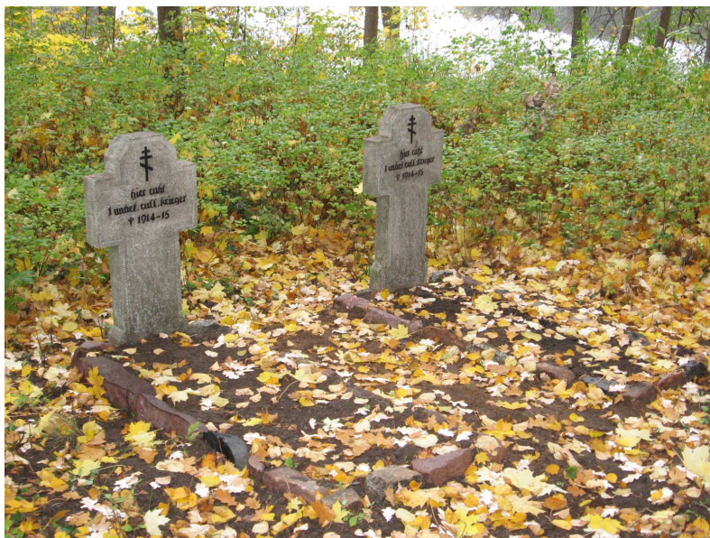
Mogiły żołnierzy rosyjskich